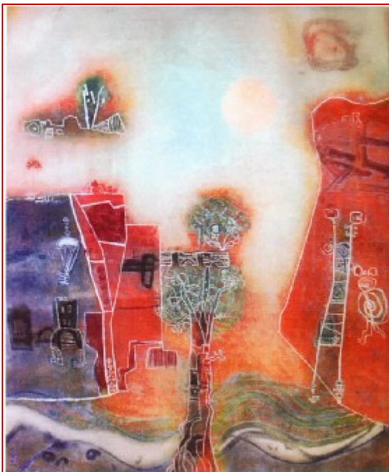
Pétit arène sur la lune Shun'ei HASEGAWA Technique mixte © Musée Daubigny, Auvers-sur-Oise