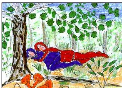
Luciole et Charles endormis