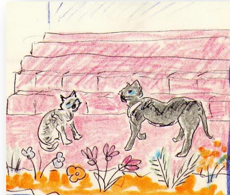
le chat Bastet et sa maman