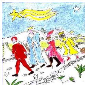
Magali et les rois mages