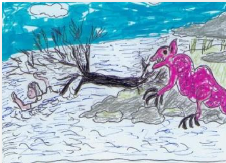
Joséphine et le dragon

Ouvrage mené de main de maître par une plume légère et imaginative !